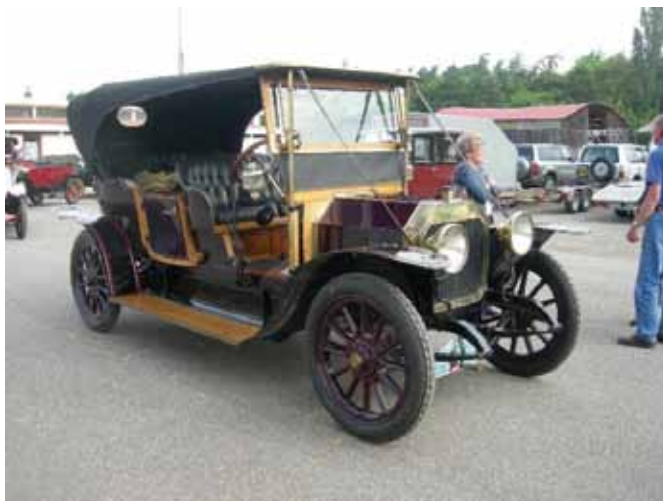
Rochet - Schneider - 1911