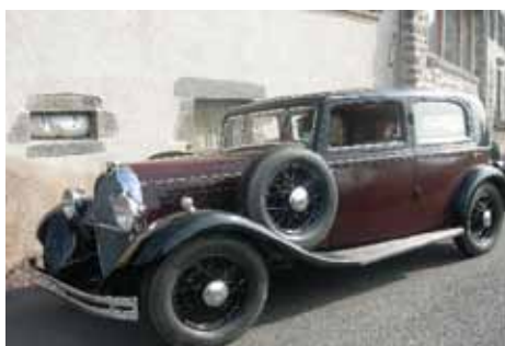
Les années 30