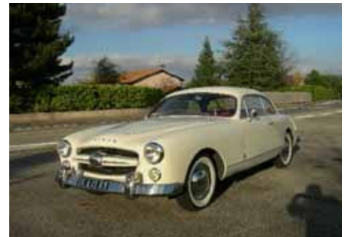
Les fifties - années 50