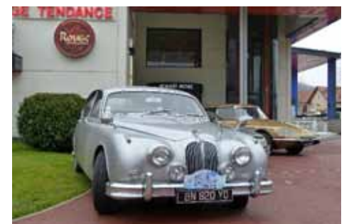
Les sixties - années 60